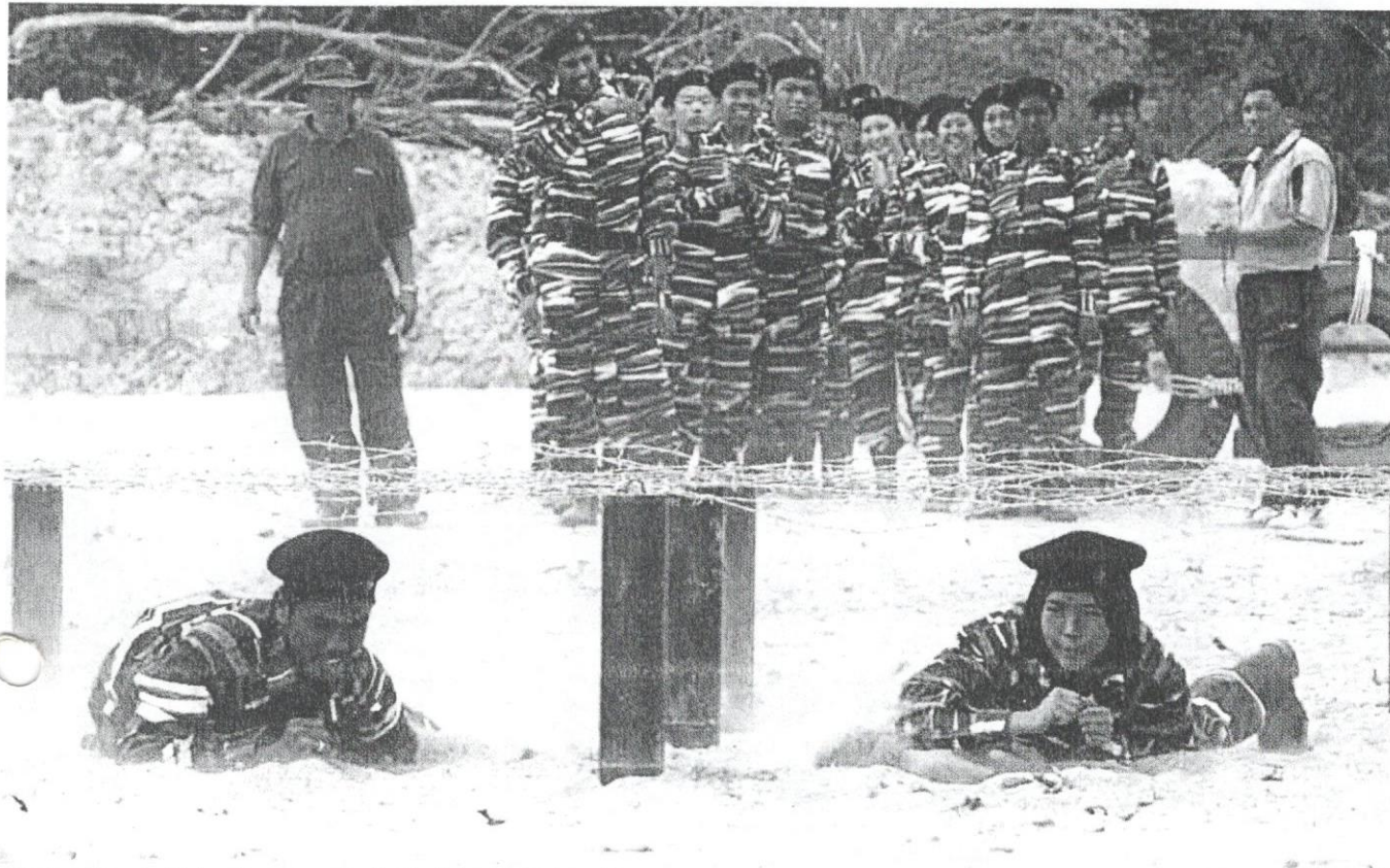
Generasi muda Malaysia sedang berlatih di kem Khidmat Negara.