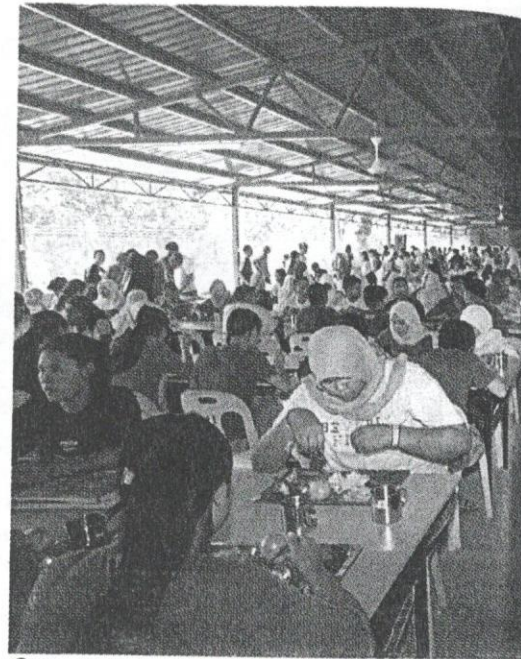
Remaja tidak harus takut mengharungi pengalaman Khidmat Negara.