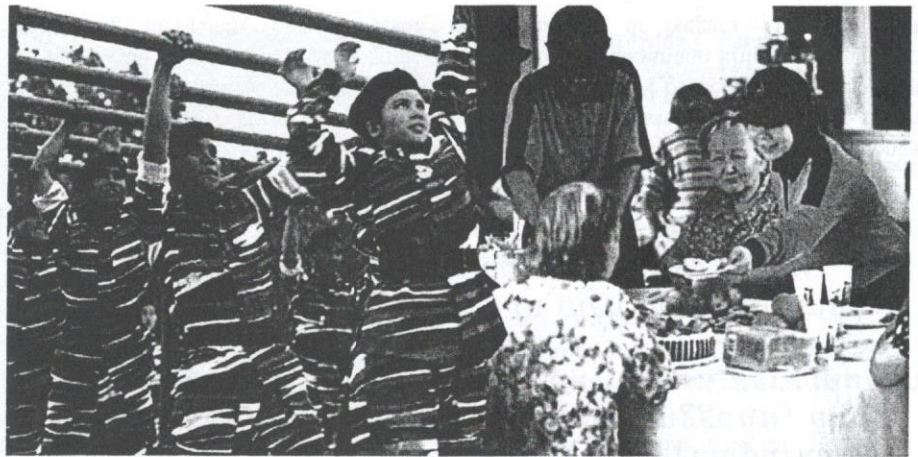
Peserta PLKN dilatih secara teori dan praktikal melalui aktiviti seperti pertahanan diri, kebajikan, sosial, dan lain-lain.

Dalam komponen pertama, peserta melalui proses penerokaan diri sendiri, menyedari dan mengenal pasti ciri-ciri diri, memperkayakan kekuatan dan memulihkan kelemahan diri.