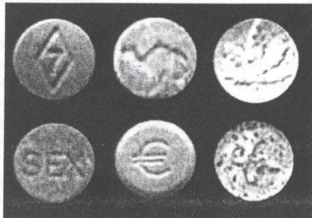
Sebahagian daripada simbol-simbol yang terdapat pada pil ecstasy

Pengetahuan mengenai bahaya pil khayal hanyalah salah satu aspek yang