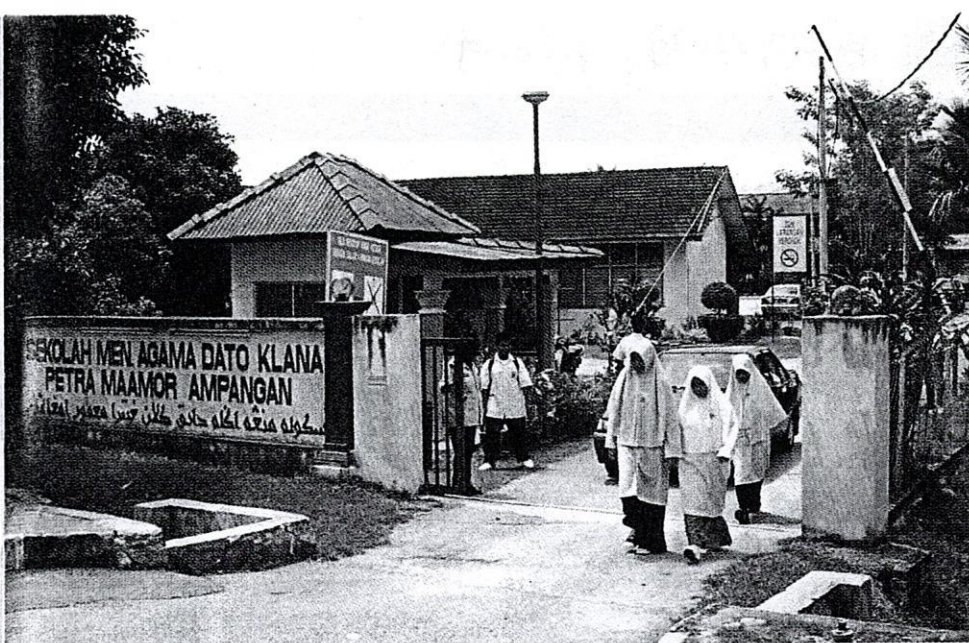
Sekolah agama juga tidak terkecuali daripada masalah disiplin dan pergaduhan di kalangan pelajar.

itu dilakukan dalam wilayah negeri berkenaan.