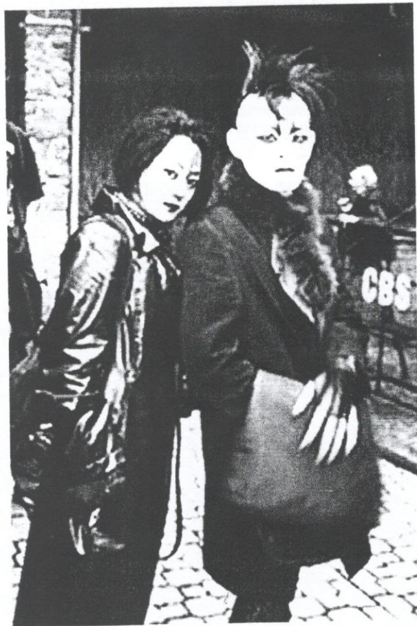
IMEJ Gothik melambangkan kegelapan dan kematian.

Di Malaysia, pengaruh Gothik muncul pada awal tahun 2000. Kebanyakan pengikutnya merupakan remaja Melayu berusia awal kelasan tahun. ■