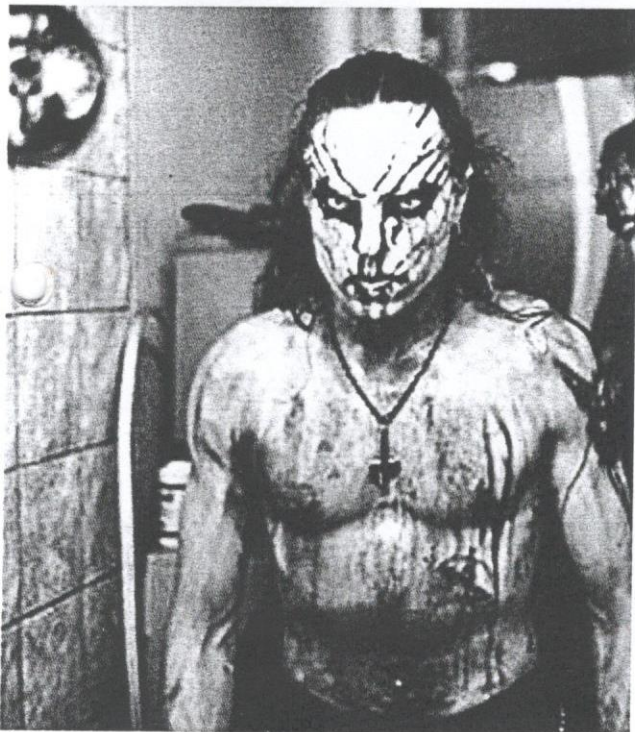
BLACK Metal secara terang-terangan menolak agama.