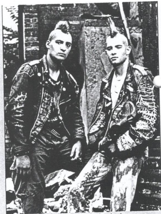
PAKAIAN pengikut Punk melambangkan keganasan.

Di Malaysia, pengaruh Punk mula bermaharajalela pada 1980-an. Kebanyakan pengikutnya di negara ini ialah remaja Melayu yang berusia belasan tahun sehingga awal 20-an.