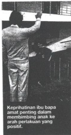
Keprihatinan ibu bapa amat penting dalam membimbing anak ke arah perlakuan yang positif.

Begitulah remaja yang semakin hilang harga diri dapat kita gilap sebagai remaja yang bermaruah sekiranya mempunyai cara yang betul untuk membimbing mereka. Insha-Allah bimbingan ikhlas ini dapat dilakukan bersama. ❁