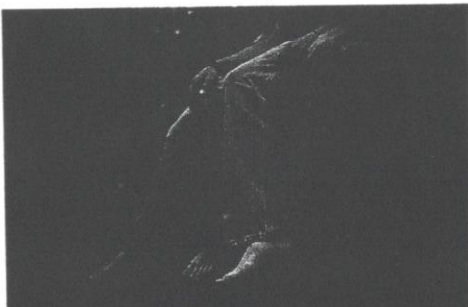
Remaja yang tidak berupaya mengawal emosi dengan baik mudah terdorong melakukan perbuatan yang negatif.