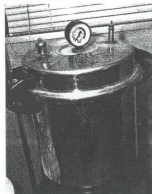
Mesin 'auto clave' untuk membunuh kuman.