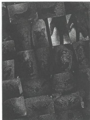
Antara pameran foto yang diambil hasil lukisan tatu pada tubuh pelanggan.

Minyak bayi disapu kepada tubuh sebelum bertindik dan bertatu manakala sebelum pelanggan ditindik pada sesuatu bahagian di mulut (lidah atau bibir), pelanggan dikehendaki berkumur dengan cecair antiseptik.