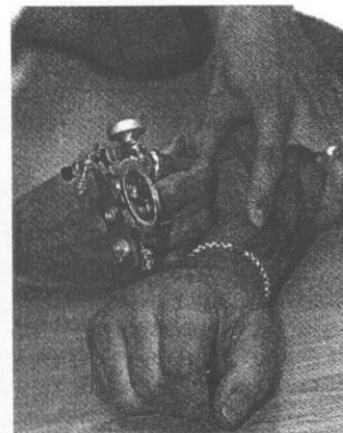
Cara mencacah tatu.