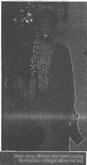
Gaya yang dibawa dari barat sering diubatkan sebagai aliran terkini.

yang bertapak tinggi dan kemeja yang agak sendat. Rambut yang kembang bagai sarang lebah menjadi pilihan, manakala yang perempuannya pula dilihat memilih gaya rambut seperti pelakon Hollywood, Farrah Fawcett, yang ikal dan sedikit berombak. Retro tahun 1970-an juga memperlihatkan pengaruh skirt sendat yang sontok menjadi kegliaan gadis remaja. Skirt mini itu selalunya dipadankan dengan baju ketat yang tidak berlingan.