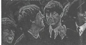
Kumpulan The Beatles.

yang bertapak tinggi dan kemeja yang agak sendat. Rambut yang kembang bagai sarang lebah menjadi pilihan, manakala yang perempuannya pula dilihat memilih gaya rambut seperti pelakon Hollywood, Farrah Fawcett, yang ikal dan sedikit berombak. Retro tahun 1970-an juga memperlihatkan pengaruh skirt sendat yang sontok menjadi kegliaan gadis remaja. Skirt mini itu selalunya dipadankan dengan baju ketat yang tidak berlingan.