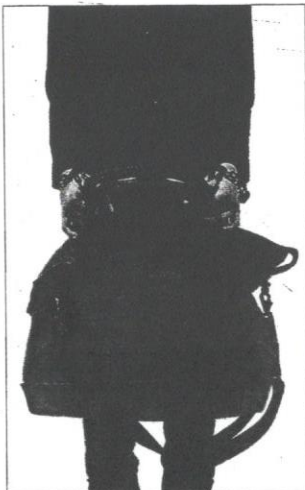
tanpa disedari ada remaja yang terjebak dan menjadi hamba kepada fesyen dan barangan berjenama.