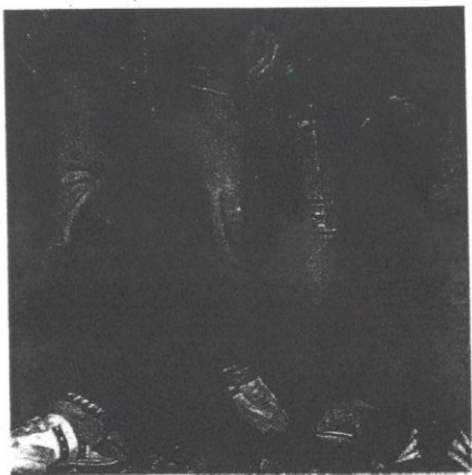
Pengaruh barangan berjenama memainkan peranan begitu penting dalam mencorakkan kehidupan para remaja.

Berbeza dengan golongan lebih dewasa yang selesa dengan jenama Giorgio Armani, Salvatore Faragamo, Gucci, Dior dan Dunhill, jenama Calvin Klein, Guess, MNG, DKNY, Quicksilver, Billabong, Zara dan Paul Smith merupakan beberapa pilihan dan