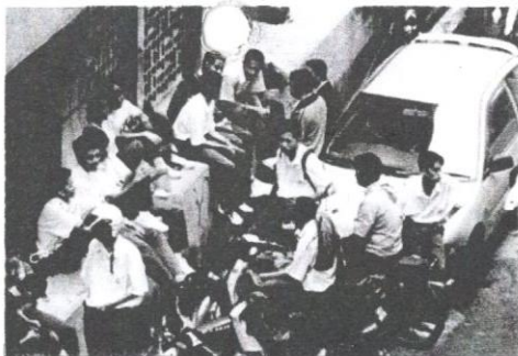
Pengaruh rakan sebaya banyak mempengaruhi tingkah laku remaja - Gambar hiasan.

remaja bukan sekadar makan minum dan wang tetapi kasih sayang dan perhatian serta panduan dan dorongan menghadapi zaman remaja yang serba mencabar.