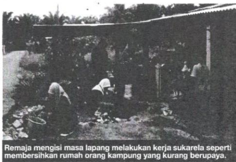
Remaja mengisi masa lapang melakukan kerja sukarela seperti membersihkan rumah orang kampung yang kurang berupaya.