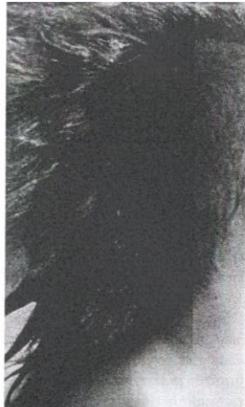
Budaya punk merupakan salah satu kesan kejutan budaya dalam kalangan remaja hari ini.

Kajian tersebut boleh dilihat dalam skop yang lebih kecil, iaitu di peringkat IPT. Apabila pelajar luar bandar, misalnya pelajar yang tinggal di pedalaman dan terpaksa menaiki bot yang memakan masa lebih tujuh jam atau melalui jalan darat yang mencabar untuk meninggalkan kampung halaman mereka yang terbelakang dari aspek pemodenan, bagi melanjutkan pelajaran ke IPT yang terletak di bandar, terdapat dua