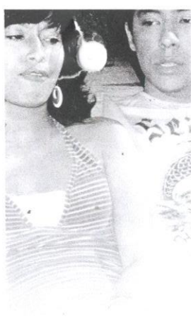
Film Bohsia banyak memaparkan masalah gejala sosial yang membelenggu remaja.

Kenyataan tersebut dikukuhkan lagi apabila pada Disember 2010, Gabungan Pelajar Melayu Semenanjung (GPMS) percaya pelajar IPT yang terlibat dengan kegiatan pelacuran adalah disebabkan keinginan mereka untuk hidup mewah. Naib Presiden Hal Ehwal Wanita