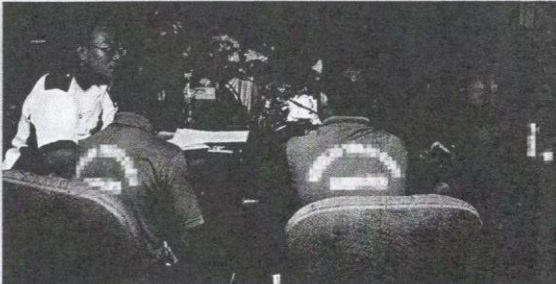
Pendekatan pemulihan terbuka diamalkan di Sekolah Tunas Bakti.

Di STB juga diwujudkan Tribunal Kanak-kanak bagi penghuni mempertahankan diri jika didapati melakukan kesalahan di dalam asrama. Secara tidak langsung tribunal ini dapat membina keyakinan dan jati diri dalam kalangan penghuni. Tribunal ini dianggotai antaranya termasuklah pengetua, pegawai kes, penghuni sebagai peguam bela dan