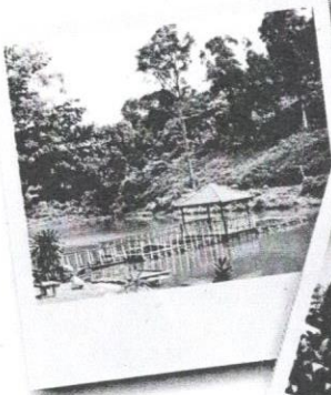
Kiri: Kawasan rekreasi. Kanan: Bengkel kemahiran.

Demikianlah sebahagian daripada catatan pengalaman di STB. Mereka menjadi mangsa keadaan disebabkan oleh kegagalan fungsi institusi keluarga. Ruang dan peluang mereka terbatas. Mereka memerlukan bantuan dan sokongan moral daripada masyarakat. Mereka sebahagian daripada kita rakyat Malaysia yang terkenal dengan budaya penyayang. Berikanlah mereka peluang kedua dan bantulah mereka untuk menjalani kehidupan yang harmoni dan sejahtera. ☺