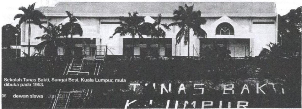
Sekolah Tunas Bakti, Sungai Besi, Kuala Lumpur, mula dibuka pada 1953.