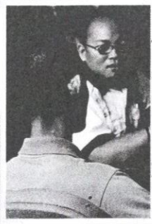
Mereka berazam untuk berubah.

Kemasukan ke STB merupakan jalan terakhir sekiranya tiada alternatif lain untuk memulihkan akhlak kanak-kanak devian. Terdapat dua prosedur kemasukan, iaitu pertama dengan perintah mahkamah di bawah Seksyen 91, Akta Kanak-kanak 2001, bagi kanak-kanak yang terlibat dengan jenayah. Kedua, kemasukan di bawah Seksyen 46, Akta Kanak-kanak 2001, iaitu ibu, bapa atau penjaga membuat permohonan kepada mahkamah untuk menempatkan anak mereka di STB atas kegagalan untuk menjaga kanak-kanak dengan sempurna. Namun, beberapa pertimbangan akan dibuat oleh majistret seperti keperluan mengadakan bengkel interaktif yang melibatkan kanak-kanak, ahli keluarga dan kaunselor. Laporan akhlak yang disediakan oleh Pegawai Akhlak dan pandangan Penasihat Mahkamah juga akan diambil kira oleh