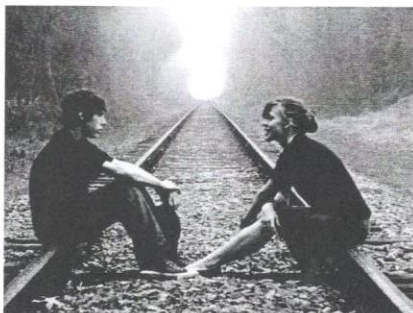
Remaja sangat cenderung untuk menggilai muzik.

Dengan menyedari peri pentingnya peranan muzik terhadap remaja, DiGi Telecommunications Sdn. Bhd. (DiGi) mengambil langkah proaktif dengan memperkenalkan program "DiGi Live Sekolahku Berbakat" bagi mencungkil potensi yang ada dalam diri mereka untuk diketengahkan menerusi seni pentas. Program inisiatif ekspresi belia