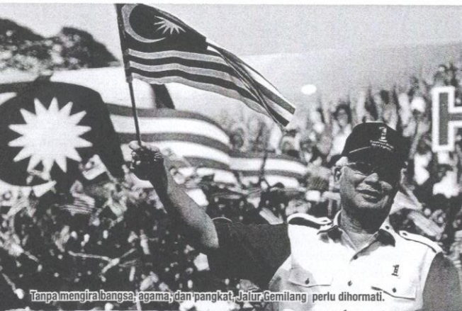
“Tanpa mengira bangsa, agama, dan pangkat, Jalur Gemilang perlu dihormati.”

pula bertindak tanpa berfikir panjang yang menyebabkan kesannya seperti yang berlaku pada malam tersebut,” jelasnya.