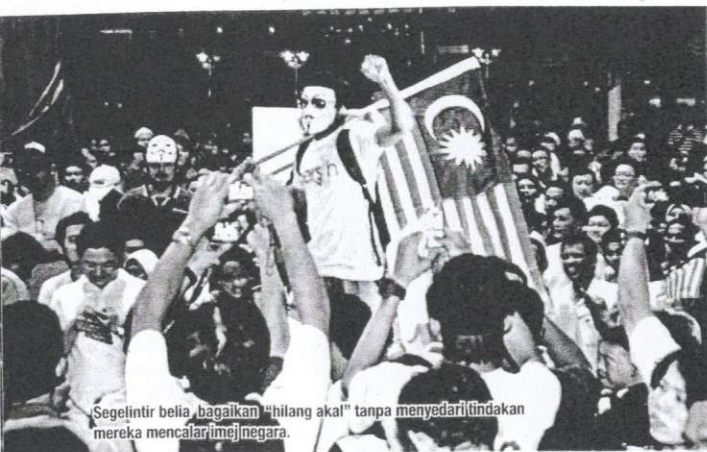
Segelintir belia, bagaikan "hilang akal" tanpa menyedari tindakan mereka mencalar imej negara.

Persoalannya, adakah rakyat Malaysia sudah terlupe detik yang bersejarah tersebut? Atau terjemahan terhadap sambutan kemerdekaan sudah berubah?