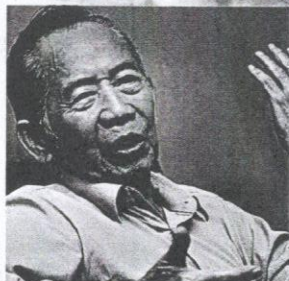
Profesor Emeritus Tan Sri Dr. Khoo Kay Kim

menunjukkan mereka tidak faham dan tidak mengerti nilai sebuah bendera. "Mereka tidak faham siapakah yang memilih sesebuah negara itu dan mengapakah bendera itu dipilih," jelasnya.