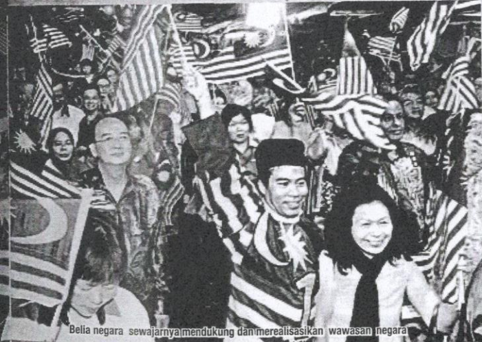
Belia negara sewajarnya mendukung dan merealisasikan wawasan negara

"Saya mewakili anak saya, ingin memohon maaf kepada seluruh rakyat Malaysia khususnya kepada Perdana Menteri dan isteri terhadap perlakuan anak saya. Saya berdoa agar anak saya insaf dan mengambil iktibar daripada kejadian tersebut," jelasnya. □