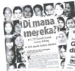
Berita tentang remaja lari dari rumah sering dilaporkan oleh media.

BERNAMA - Seorang gadis berusia 16 tahun yang lari dari rumah di Kuala Lumpur, ditemui di Pulau Pinang.