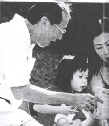
Ibu bapa memainkan peranan penting dalam mendidik dan mengawasi anak.

Polis mendedahkan bahawa hasil soal siasat terhadap mangsa yang berjaya ditemui dan ahli keluarga mangsa yang masih hilang, kebanyakan mangsa bertindak lari dari rumah kerana mengikut teman lelaki sama ada rakyat tempatan atau warga asing. Selain itu, pengaruh