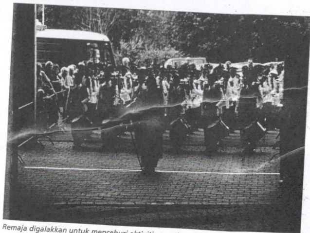
Remaja digalakkan untuk menceburi aktiviti yang dapat meningkatkan keyakinan diri.