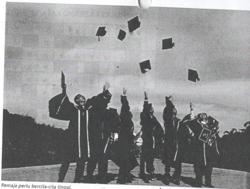
Remaja perlu bercita-cita tinggi.