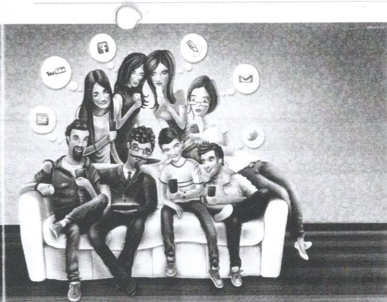
Gambar 1 Media sosial menjadi salah satu pemangkin yang menyebabkan remaja semakin leka dan mengabaikan interaksi.