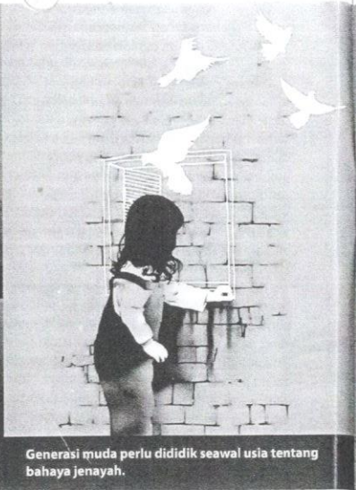
Generasi muda perlu dididik seawal usia tentang bahaya jenayah.

penderaan, buli, pembunuhan dan pelacuran. Kes seumpama ini dilihat semakin serius dan membimbangkan.