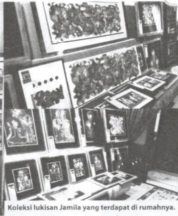
Koleksi lukisan Jamila yang terdapat di rumahnya.