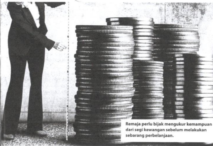
Remaja perlu bijak mengukur kemampuan dari segi kewangan sebelum melakukan sebarang perbelanjaan.

menunjukkan bahawa remaja amat memerlukan bimbingan dan pengetahuan yang baik tentang aspek pengurusan kewangan. Setiap remaja seharusnya didedahkan sejak dari bangku persekolahan tentang perbezaan konsep keperluan dan kehendak dalam pengurusan kewangan. Kegagalan membezakan dua konsep penting ini telah menjerumuskan remaja ke dalam masalah pengurusan kewangan yang tidak teratur. Sebagai buktinya, remaja cenderung menggunakan kemudahan pinjaman yang disediakan oleh institusi kewangan bagi memenuhi kehendak melebihi daripada keperluan yang sepatutnya. Kesannya, remaja tidak mampu membayar balik pinjaman dan seterusnya diisytiharkan mufis.