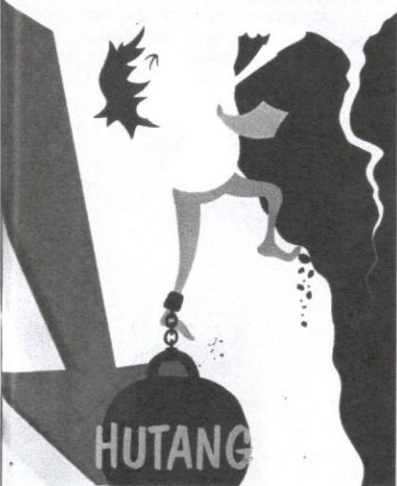
Amalan berhutang akan menjerat remaja ke kancuh mufis.

Statistik daripada Jabatan Insolvency Malaysia berkaitan dengan pembabitn remaja dalam pinjaman kewangan yang bertujuan untuk memenuhi kehendak peribadi seperti pinjaman peribadi, sewa beli kenderaan dan pinjaman perumahan