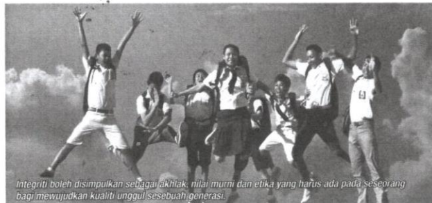
Integriti boleh disimpulkan sebagai akhlak, nilai murni dan etika yang harus ada pada seseorang bagi mewujudkan kualiti unggul sebuah generasi.

Dengan ini dapat disimpulkan jika generasi muda tidak mampu berubah mulai sekarang, jangan sesekali mengatakan Transformasi Nasional 2050 (TN50) mampu dilaksanakan. Sebaliknya, ia hanya akan menjadi omongan kosong dan perancangan tanpa tindakan. Lantas, pembentangan bangsa Malaysia yang berintegriti direalisasikan. Oleh itu sewajarnya kembali kepada asas pegangan yang berpandukan al-Quran dan Sunnah untuk mencorakkan integriti, etika, nilai moral yang penuh ber hikmah