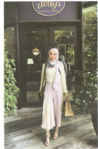
Wani menjadikan hijabis Timur Tengah sebagai rujukan fesyen yang digayakan olehnya.