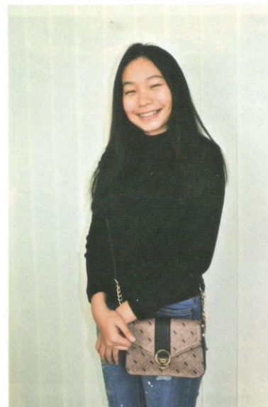
Gaya suai dan padan sangat praktikal dengan remaja di Malaysia kerana ringkas dan mudah diaplikasikan.