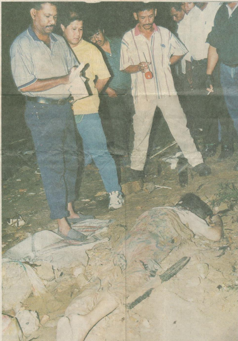
MANGSA rogol didera, diperkosa, diliwat dan dibunuh dalam keadaan mengaibkan. — Gambar hiasan

Faktor persekitaran yang tidak dapat dinafikan sebagai faktor penyumbang, seperti suasana atau tempat kejadian, film atau majalah yang menayangkan cerita ganas juga boleh menjadi pendorong masalah ini.