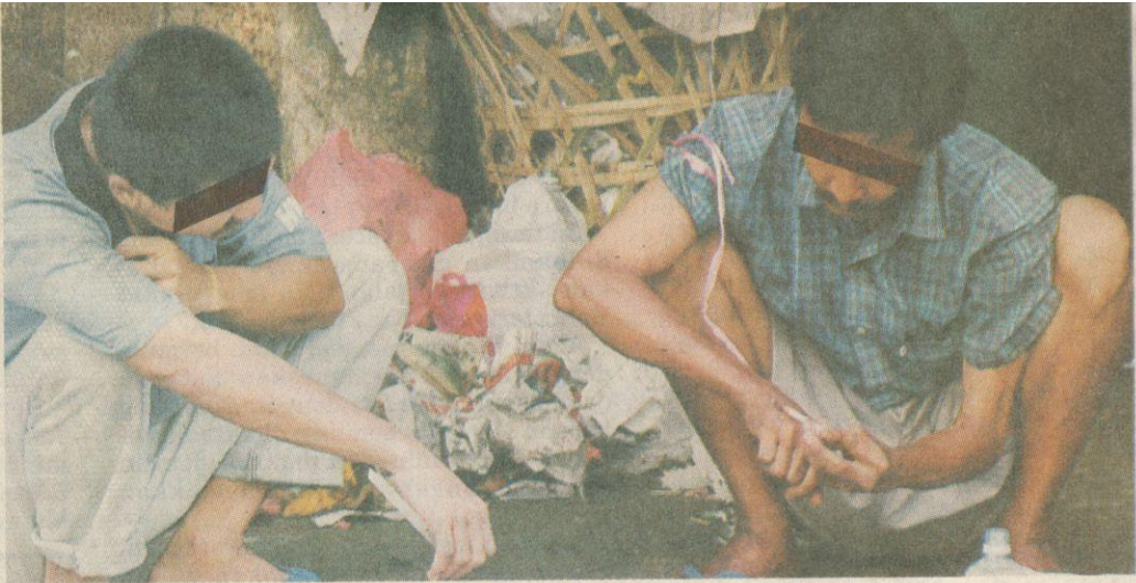
PENYALAHGUNAAN dadah antara faktor yang mendorong jenayah seumpama ini. – Gambar hiasan