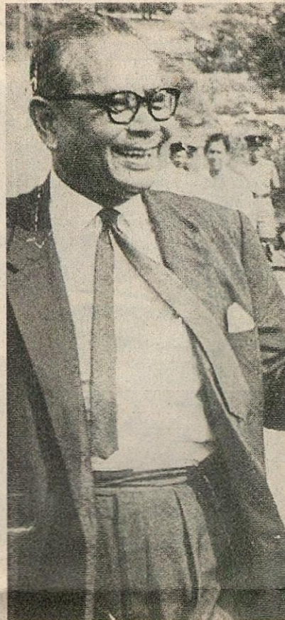
KENANGAN LALU: Tunku Abdul Rahman (tengah) dan Ismail pada 13 Julai 1962.

Mulai esok, Berita Harian menyiarkan rencana lima siri petikan daripada buku Bukan Kerana Pangkat mengenai kisah hidup Dr Ismail. Siri pertama esok memaparkan kisah bagaimana Tun Abdul Razak dan Dr Ismail merahsiakan penyakit yang mereka hadapi. - Pengarang