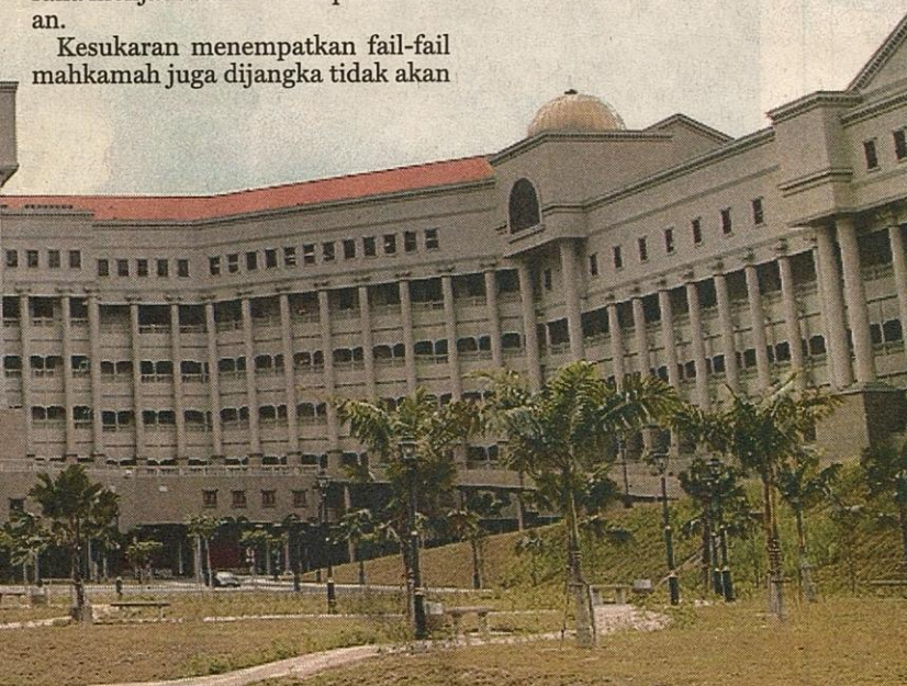
KOMPLEKS Mahkamah Tinggi Kuala Lumpur, Jalan Duta.

Adalah diharapkan dengan adanya kompleks yang indah dan perkhidmatan yang cemerlang daripada pihak atasan hinggalah kakitangan sokongan mampu menaikkan prestasi dan imej Badan Kehakiman negara ini di peringkat global.