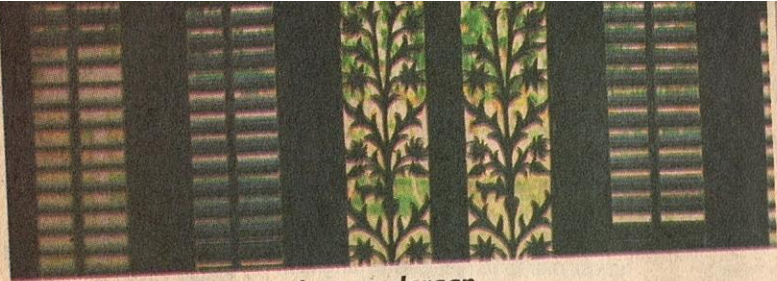
■ ELEMEN ventilasi untuk pengudaraan.

masa kini, kita seharusnya mencari keistimewaan yang tersembunyi dalam diri kita sendiri dan bukan meniru keistimewaan orang lain.