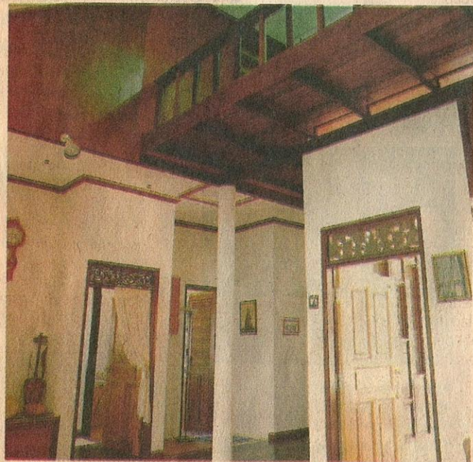
■ RUANG dalam terbuka berciri loteng.

Masih belum terlambat bagi kita menimba ke dalam budaya dan tradisi sendiri dan mengamalkan aspek berkenaan untuk kebaikan dan memperkembangkan untuk pembangunan fizikal, spiritual dan intelektual.