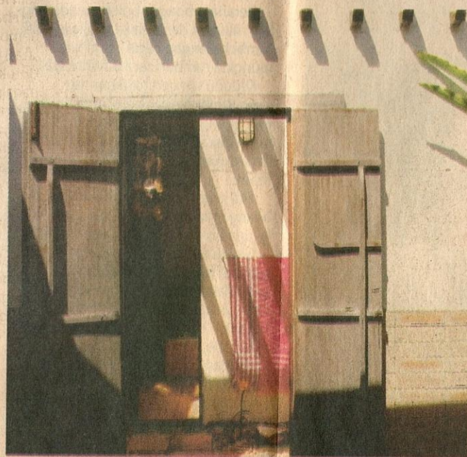
■ PINTU kayu tradisional.