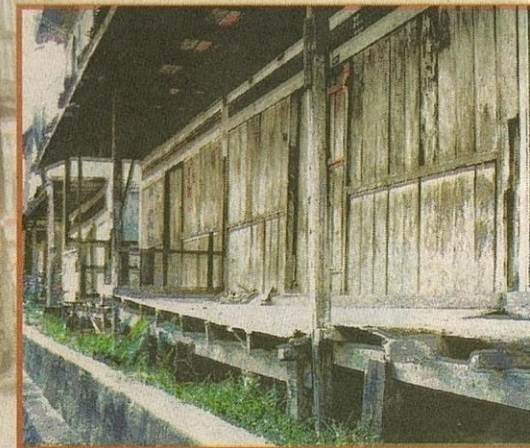
RUANG anjung di bahagian hadapan rumah.

Rumah kedai ini juga memiliki ukiran yang menarik iaitu bermotifkan kuih putu pada lubang angin di tingkat bawah serta kelarai anyaman dinding buluh yang berdasarkan corak bunga tanjung pada rumah dapur.