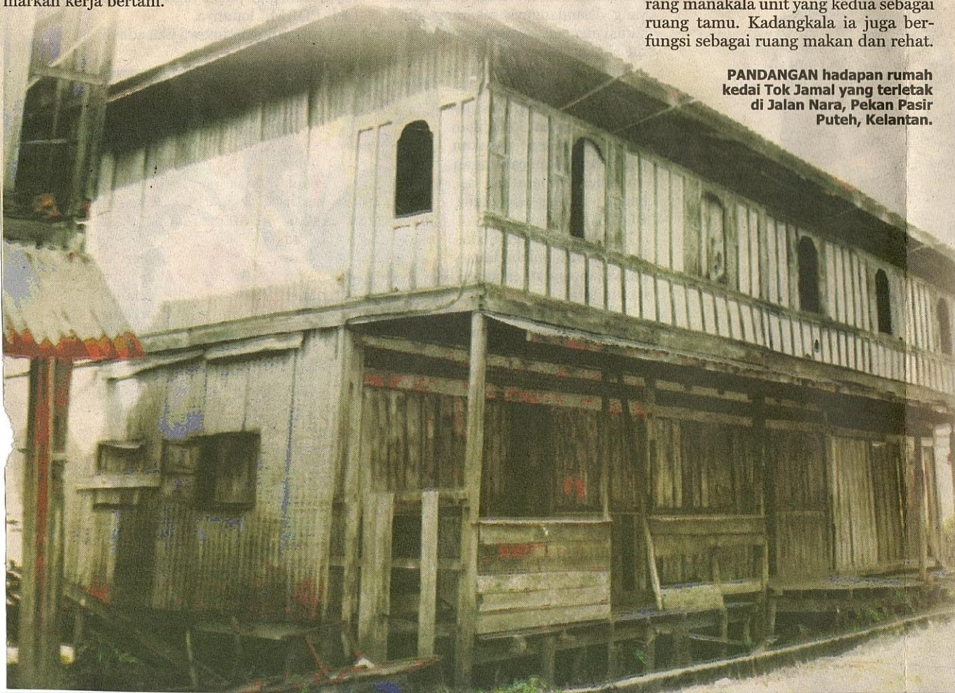
PANDANGAN hadapan rumah kedai Tok Jamal yang terletak di Jalan Nara, Pekan Pasir Puteh, Kelantan.

Ruang dalaman rumah ini terbahagi kepada anjung di bahagian hadapan rumah, ibu rumah iaitu ruang yang terbesar dan rumah dapur serta jemuran di bahagian belakang rumah. Rumah ibu ialah ruang yang terbesar dan paling utama. Ia terbahagi kepada dua unit iaitu unit pertama dikhususkan sebagai gudang menyimpan barang manakala unit yang kedua sebagai ruang tamu. Kadangkala ia juga berfungsi sebagai ruang makan dan rehat.