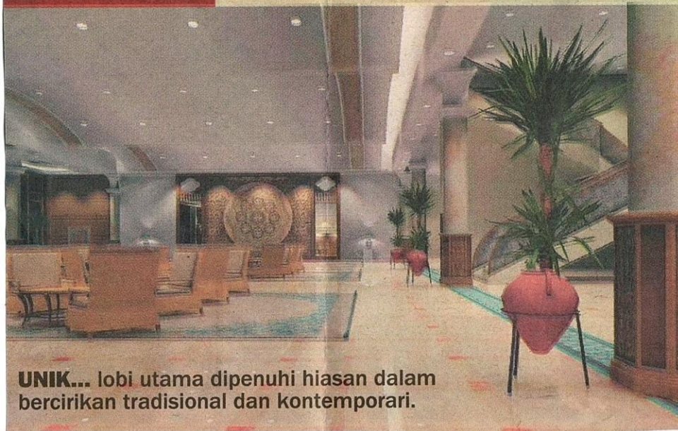
UNIK... lobi utama dipenuhi hiasan dalam bercirikan tradisional dan kontemporari.

Dalam melaksanakan tugas berkenaan, Casa Impian, diketuai Pengarah Kreatifnya, Mohammad Zakhir Mustaffa, mengambil masa lebih enam bulan sebelum dapat menghasilkan gambaran reka bentuk dan hiasan dalaman seperti yang dikehendaki.