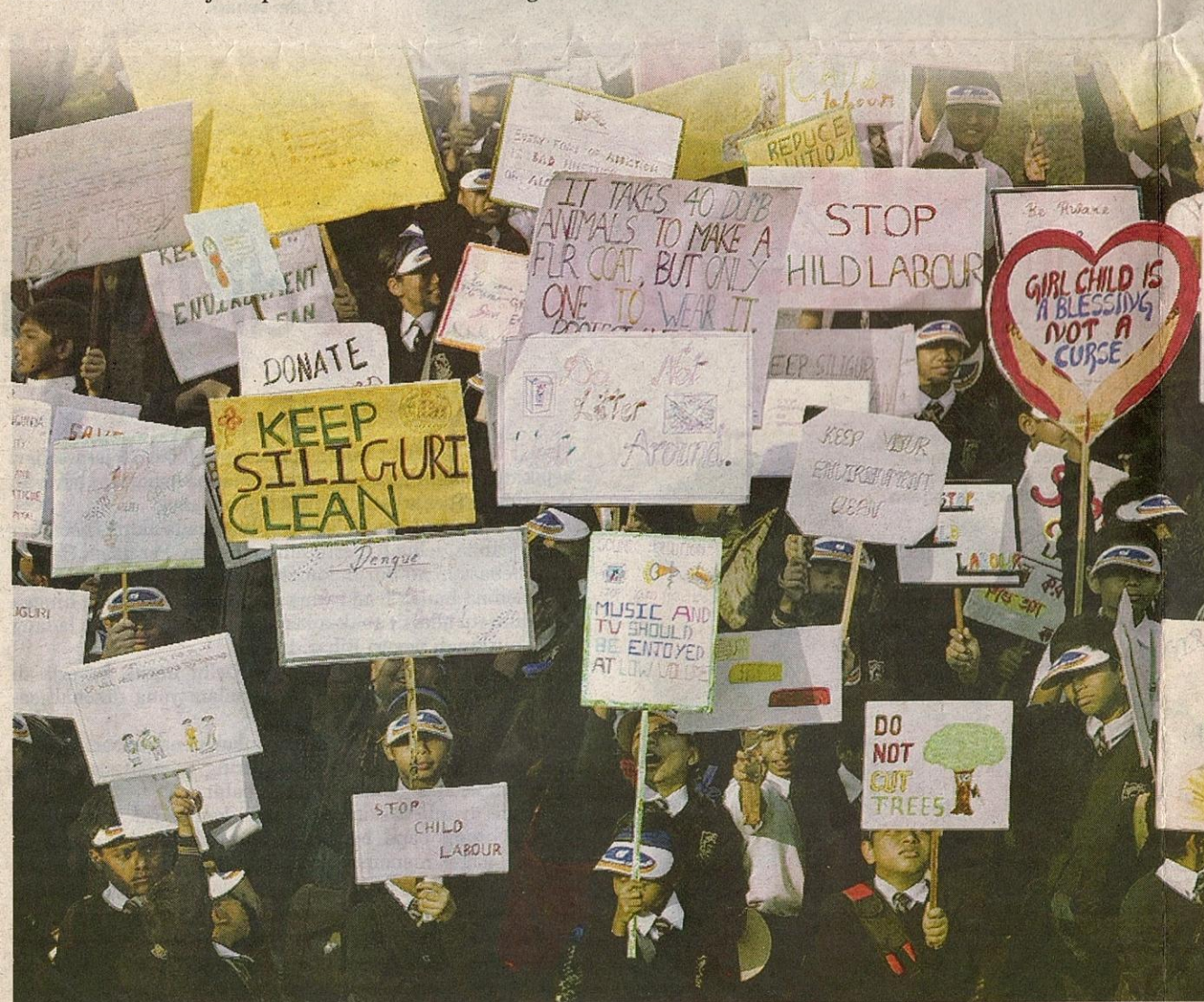
SEBAHAGIAN pelajar sekolah terlibat dalam tunjuk perasaan menentang buruh kanak-kanak di Siliguri, India.

Buruh kanak-kanak itu biasanya datang dari keluarga papa kedana dan tidak pernah bersekolah. Dalam banyak kes, merekalah satu-satunya penyumbang nafkah kepada keluarga.