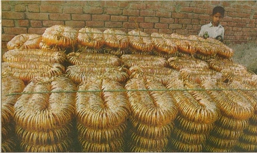
BURUH kanak-kanak sering dijadikan mangsa penderaan dan ada ketikanya taraf mereka seperti hamba abdi.