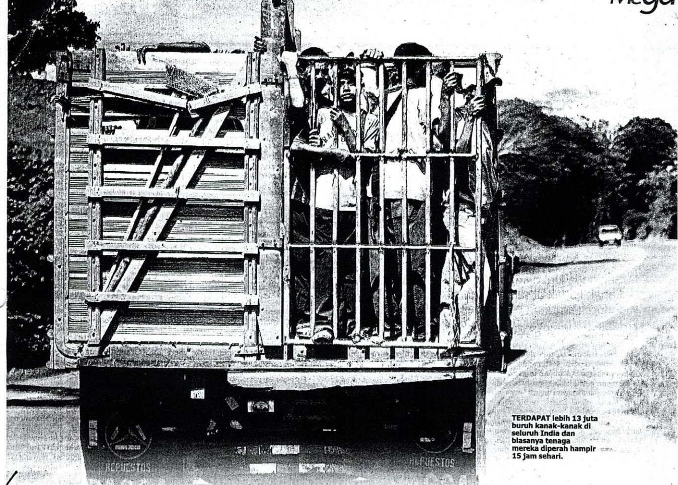
TERDAPAT lebih 13 juta buruh kanak-kanak di seluruh India dan biasanya tenaga mereka diperah hampir 15 jam sehari.