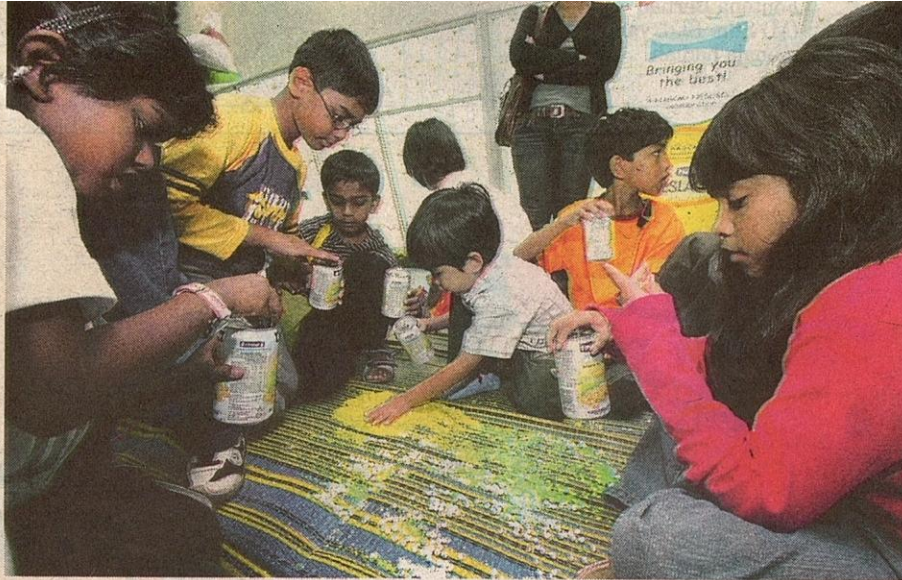
MEWUJUDKAN kerja berkumpulan menjadi objektif utama bengkel ini.