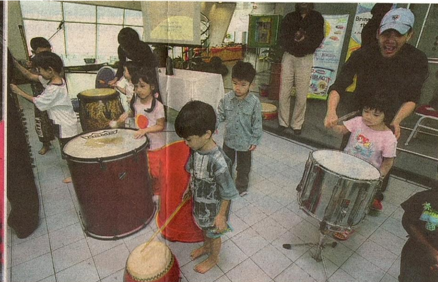
MUZIK bukan sekadar hiburan, malah dapat meningkatkan minda kanak-kanak.

↳ "Jika mereka tidak dapat mengenal pasti rentak pada setiap perkataan yang diucapkan, maka setiap percakapan mereka akan menjadi kelam-kabut. Oleh itu, rentak adalah komponen penting terhadap kanak-kanak yang masih kecil," ujarnya ketika ditemui KOSMO!