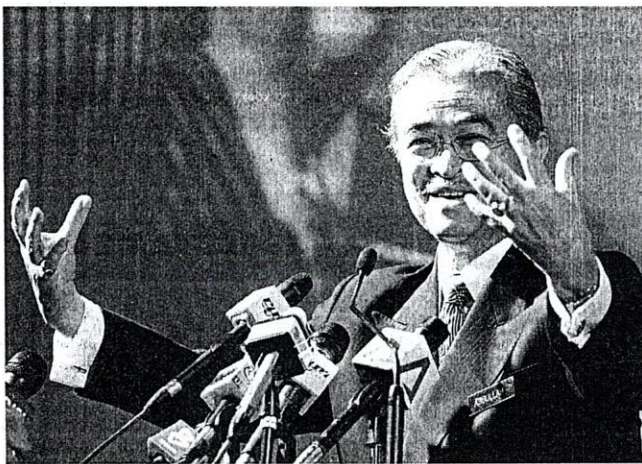
WAWASAN NEGARA: Abdullah ketika menyampaikan ucpatama pada persidangan pelaburan Invest Malaysia 2007, minggu lalu.

Krisis mata wang Asia pada 1997-1998 baru saja melepasi kita. Isu dan cabaran sepanjang krisis itu sudah ditangani sepenuhnya. Keyakinan mula bertapak kukuh di negara ini. Pelaburan sektor swasta meningkat 9.7 peratus pada 2006, lebih tinggi berbanding 8.5 peratus pada 2005. Pelaburan portfolio merekodkan kemasukan bersih sebanyak RM14.7 bilion pada 2006, berbanding pengaliran keluar RM14.2 pada 2005. Ini seiring pengembangan pasaran saham dan hutang, terutama dalam pelaburan Islam.