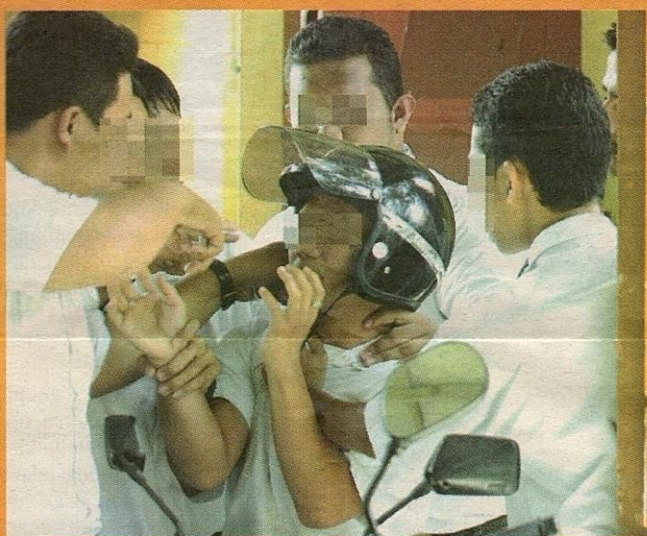
MAAFKAN SAYA... mangsa buli mengalami trauma yang berpanjangan.

lain, gunakanlah kerana pelajar hari ini bukanlah seperti dulu yang takut dan terlalu hormatkan guru.