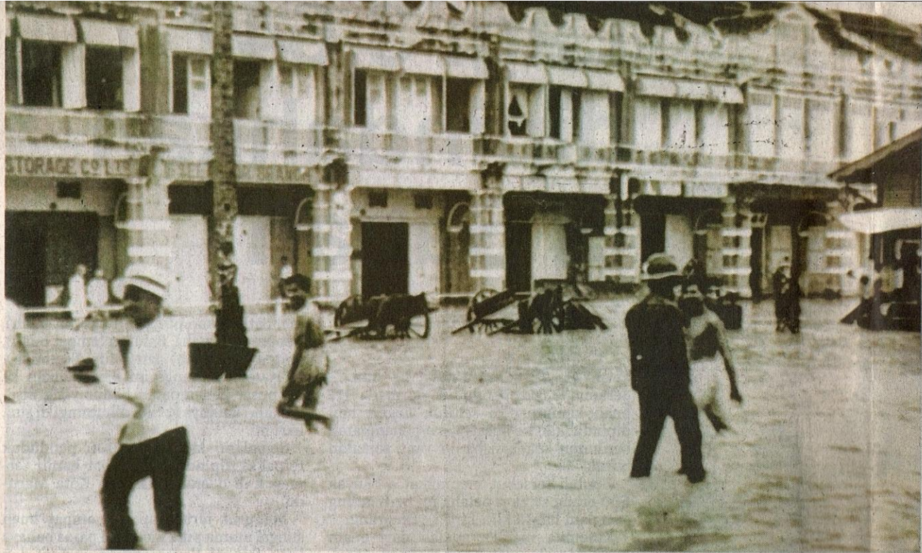
PENDUDUK meredah air yang hampir surut setelah 'Bah Besar' di Kuala Lumpur pada tahun 1926.