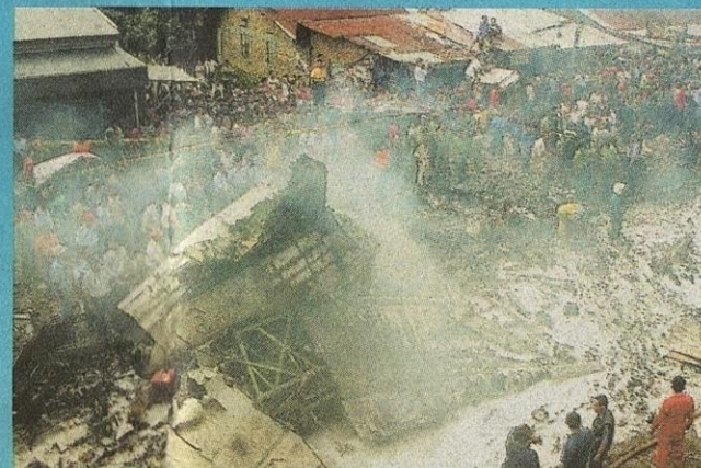
> NAHAS UDARA... pesawat Mandala Airlines jatuh terhempas di kawasan perumahan di Medan, Sumatra, 5 September 2005, menyebabkan 149 terbunuh.