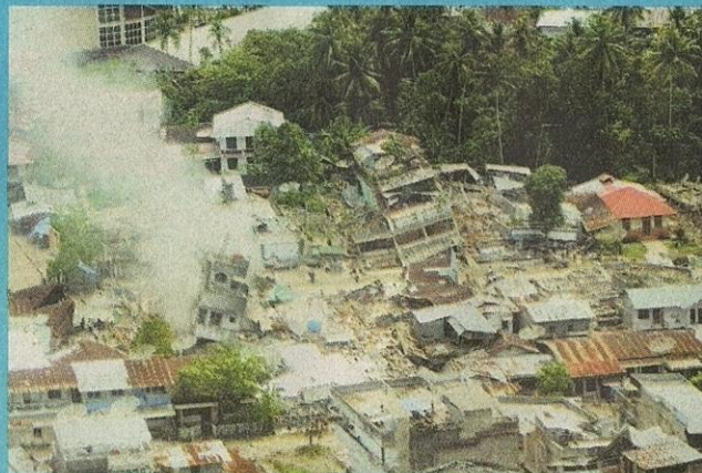
> GEMPA BUMI... bandar Gunung Sitoli ranap selepas gempa bumi yang melanda pulau Nias pada 29 Mac 2005 menyebabkan kira-kira 1,000 terbunuh.