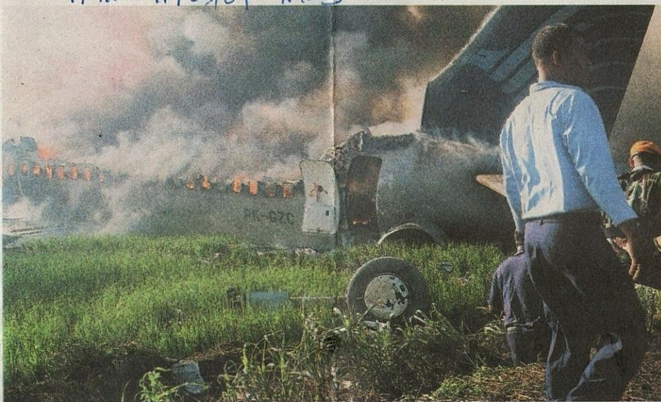
MASIH BERASAP... kapal terbang Garuda terhempas di Yogyakarta pada 7 Mac lalu, mengorbankan lebih 20 nyawa.