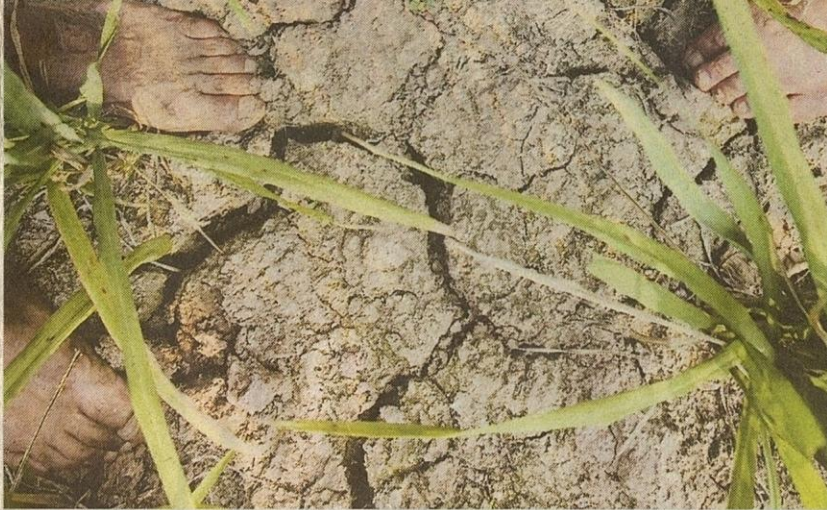
POKOK padi berhempas pulas untuk terus hidup di tanah yang kering kontang akibat kemarau.

Krisis kekurangan air akibat kemarau panjang pada 1998 bukti jelas bahawa tidak mustahil untuk kita ber-