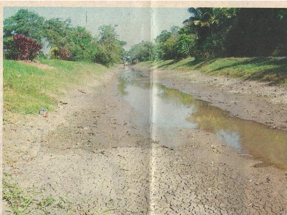
PENTINGNYA satu sistem Pengurusan Lembangan Sungai Bersepadu disediakan di semua negeri bagi melindungi sumber air daripada pencemaran.