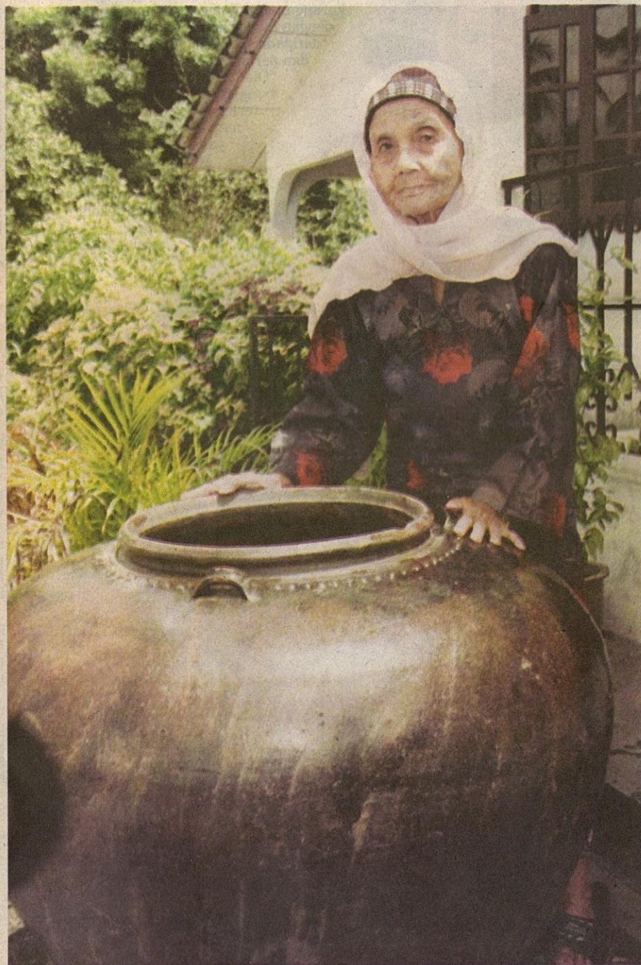
MENAKUNG atau menyimpan air hujan di dalam tempayan telah diamalkan di kampung-kampung Malaysia sejak zaman berzaman.

● Kira-kira 22,000 pesawah di Kedah mengalami kerugian besar kerana musim kemarau menyebabkan tanaman padi terbantut.