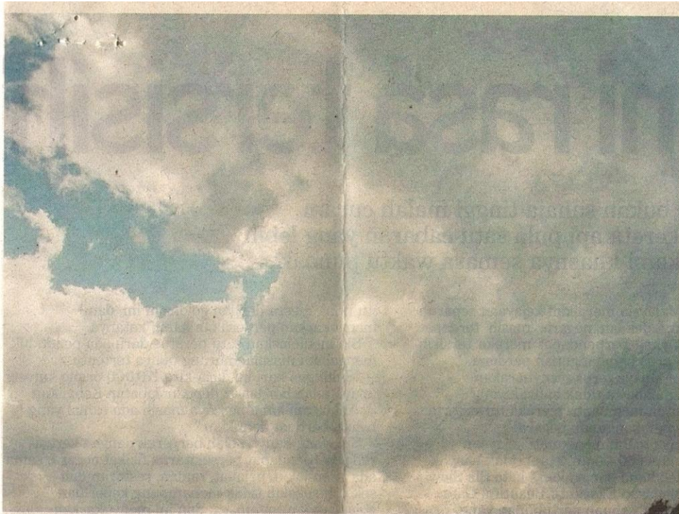
KIRA-KIRA 360 bilion meter padu mengewap ke atmosfera di Malaysia.