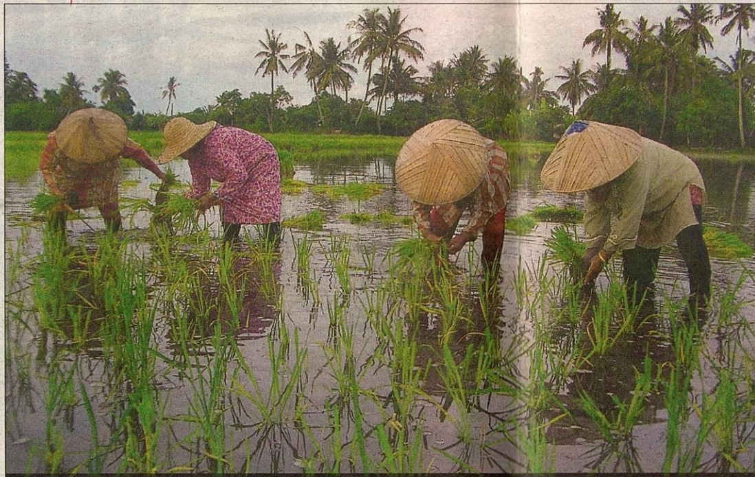
KEGIATAN di 611,000 hektar sawah padi di Malaysia dikatakan berupaya meningkatkan suhu di kawasan sekitar.

Metana terhasil daripada aktiviti bakteria dalam tanah liat dan suhu ideal air sawah disokong pancaran matahari dan gas itu meningkat akibat kekurangan oksigen di sekitar sa-