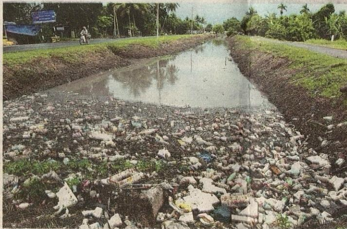
KEBANYAKAN sungai kini menjadi pembentung najis terbuka.