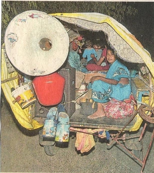
PENDUDUK Chennai di selatan India yang tinggal di pesisir pantai diarah meninggalkan rumah masing-masing setelah amaran tsunami dikeluarkan oleh pihak berkuasa negara itu berikutan kejadian gempa bumi kuat di Indonesia.