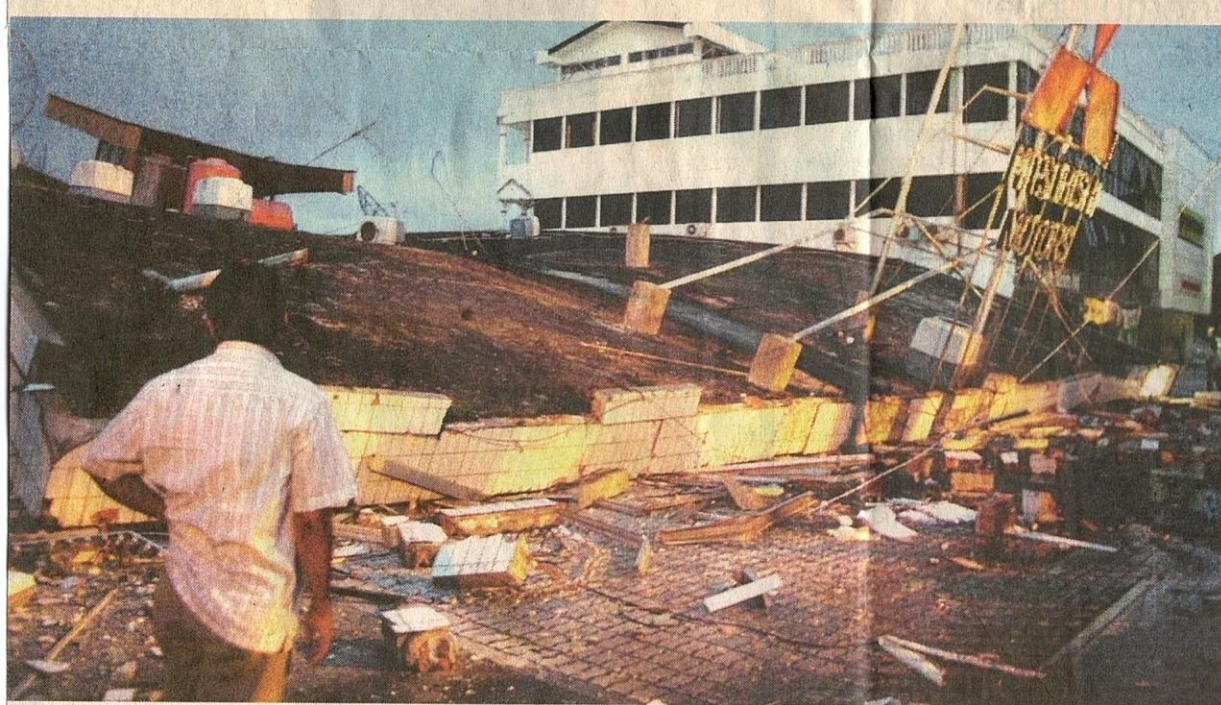
SEORANG penduduk melihat runtuh bangunan akibat gempa bumi kuat yang melanda wilayah Padang, Sumatera Barat, Indonesia, semalam.