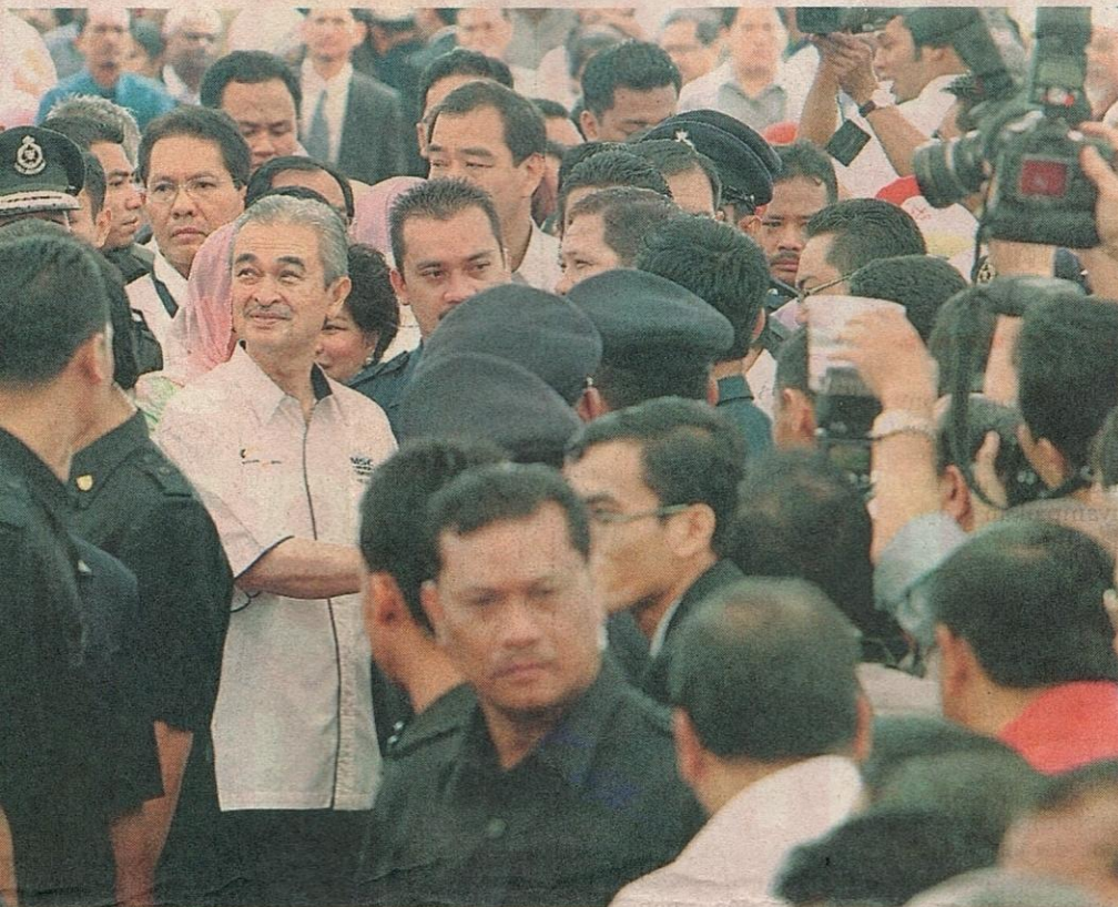
sokongan daripada masyarakat pelbagai peringkat.