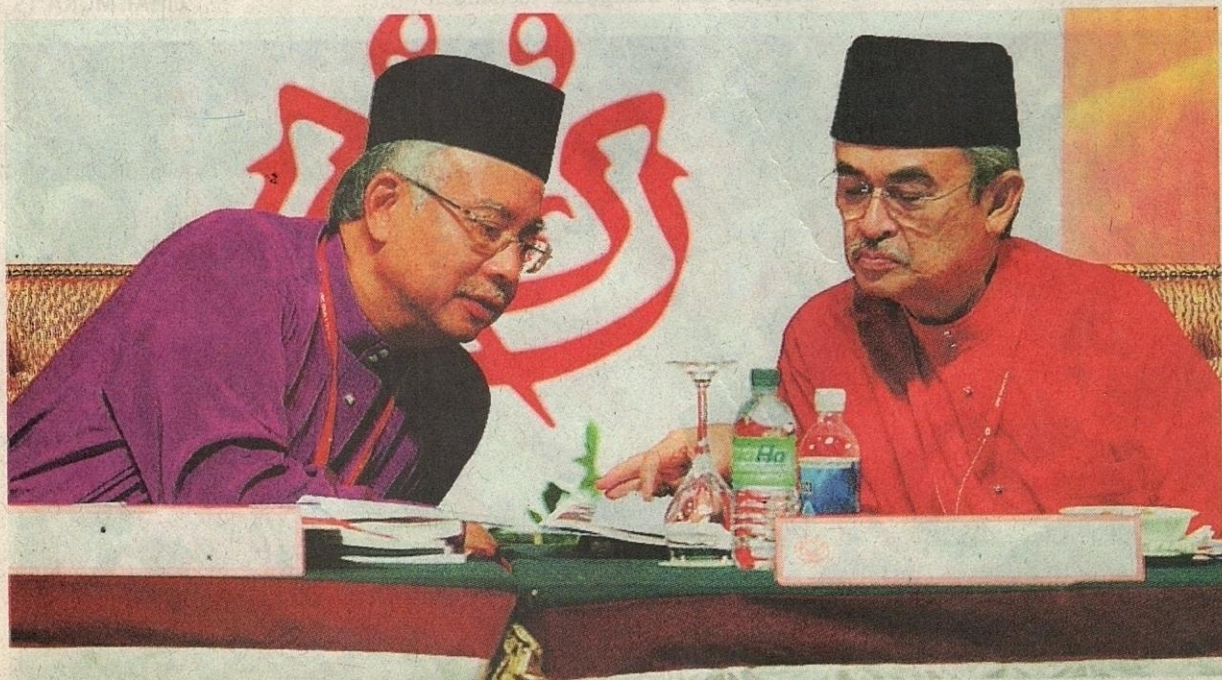
MARTABAT BANGSA: Presiden Umno, Datuk Seri Abdullah Ahmad Badawi dan Timbalannya, Datuk Seri Najib Razak berbincang sesuatu pada.

Oleh itu, tanggapan bahawa Wilayah Pembangunan Iskandar akan memudaratkan kaum Melayu sebenarnya adalah kalimah penghinaan terhadap keupayaan anak Melayu untuk bersaing di dunia global. Melalui