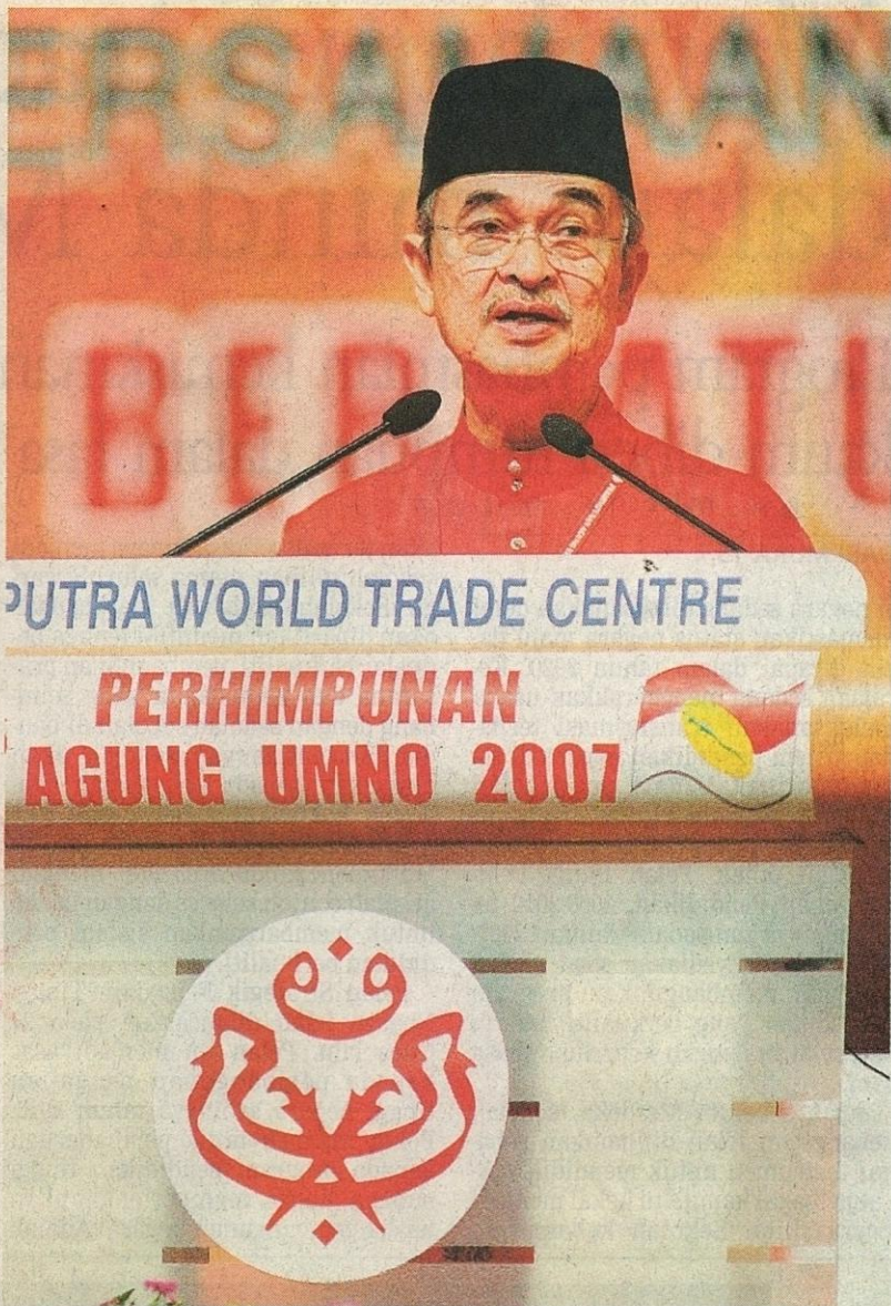
INSAN BERKUALITI: Abdullah mengajak bangsa Melayu berhijrah ke era baru dan mencipta kemajuan lebih gemilang ketika menyampaikan ucapan dasar pada Perhimpunan Agung Umno 2007, kelmarin.

Bahawa koridor-koridor ekonomi perlu dilihat sebagai gagasan besar untuk melonjakkan setiap warga Malaysia - terutamanya anak Melayu - ke arah kemakmuran dan kesejahteraan. Kalau dulu kita berbicara tentang 'towering Malay' inilah sba-