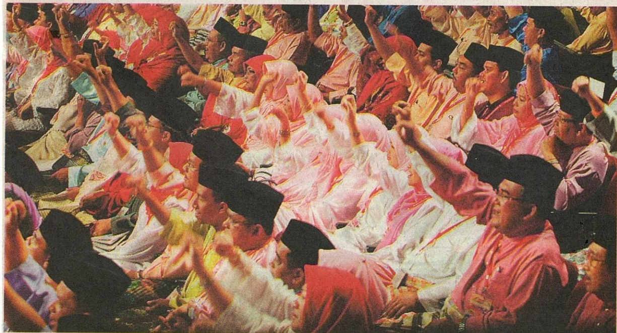
SEMANGAT WAJA: Perwakilan turut melaungkan 'Hidup Umno, Hidup Melayu' pada akhir ucapan perasmian.