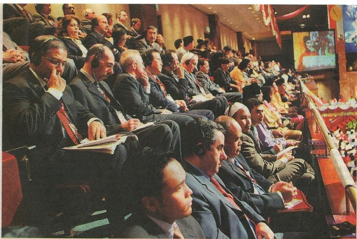
KEHEBATAN PEMIMPIN MELAYU: Sebahagian pemerhati parti politik luar negara yang hadir mendengar ucapan Presiden pada Perhimpunan Agung Umno 2007, kelmarin.

tergugul yang dinamakan 'universiti apeks' turut diperkenalkan.