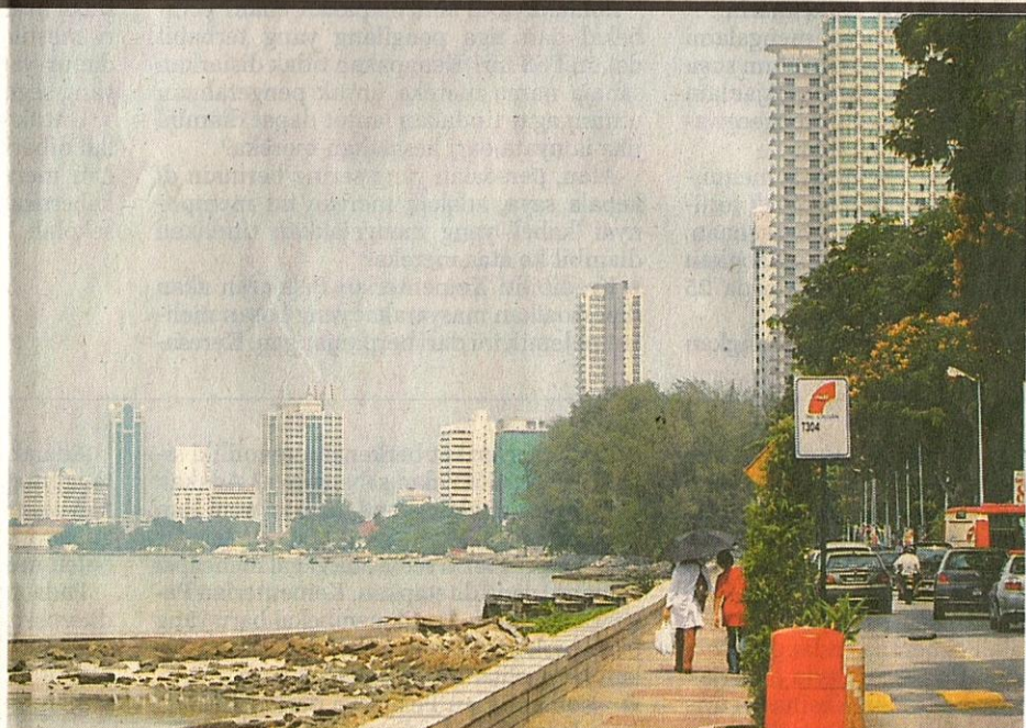
KINI PERSEKITARAN kawasan Persiaran Gurney (dahulu dikenali sebagai Pantai Kelawai) yang dimajukan.