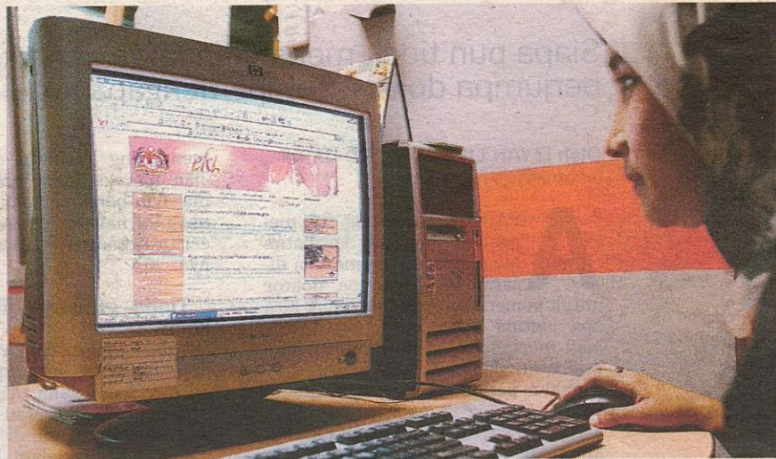
DIANGGARKAN 400 perkhidmatan secara talian boleh digunakan oleh orang ramai dan komuniti perniagaan.

Untuk kemudahan pelanggan berurusan dengan pihak berkuasa tempatan terutamanya perunding arkitek atau jurutera, e-Submission akan dilaksanakan di semua PBT di Lembah Klang penghujung tahun ini.