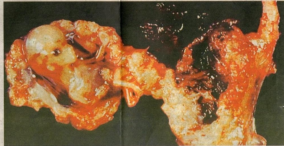
PID yang tidak dirawat awal boleh meningkatkan kehamilan ektopik.

Jika tidak mendapat rawatan awal, jangkitan bakteria akan memburukkan lagi sistem reproduksi wanita. Ada kemungkinan menyebabkan kehilangan tiub fallopio, ovari atau rahim secara keseluruhan. Mujurlah, ramai wanita mendapat rawatan pada peringkat awal jangkitan. Dengan ini, risiko kehilangan sebahagian sistem reproduksi dapat dikurangkan.