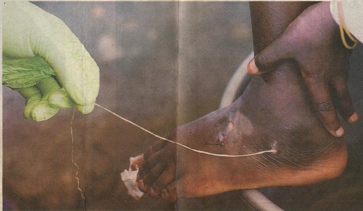
SEKOR cacing guinea ditarik keluar dari kaki seorang kanak-kanak.