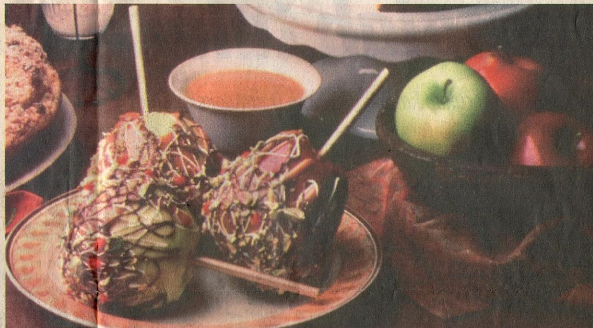
BUKA SELERA: Pelbagai cara menghidangkan epal.

Epal ranggup yang penuh jus ini mempunyai rasa yang kaya termasuk rasa masam digandingkan bersama perisa yang seperti dibubuh rempah. Namanya Braeburn. Ia berwarna kuning tapi diliputi dengan warna