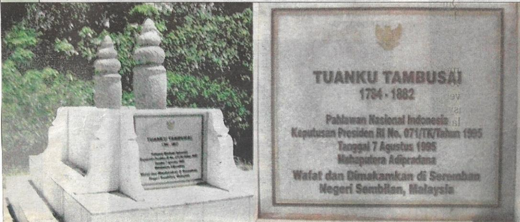
MAKAM Tuanku Tambusai di Rasah, Seremban, Negeri Sembilan yang dibina oleh pemerintah Indonesia.

Bunga api Perang Paderi mulai berlaburan pada tahun 1803 yang dihidupkan oleh Haji Miskin dari Pandai Sikat, Haji Sumanik dari Tiga Belas Koto dan Haji Piobang dari Tanah Datar. Kemunculan Tuanku Tambusai dengan pasukannya di bahagian utara terutama sekitar daerah Hulu Sungai Rokan menyebabkan Tuanku Imam Bonjol dapat bertahan dari serangan Belanda lebih lama kerana pasukan Tuanku Imam Bonjol posisinya di bahagian tengah. Taktik dan strategi perang diatur dua bahagian oleh Tuanku