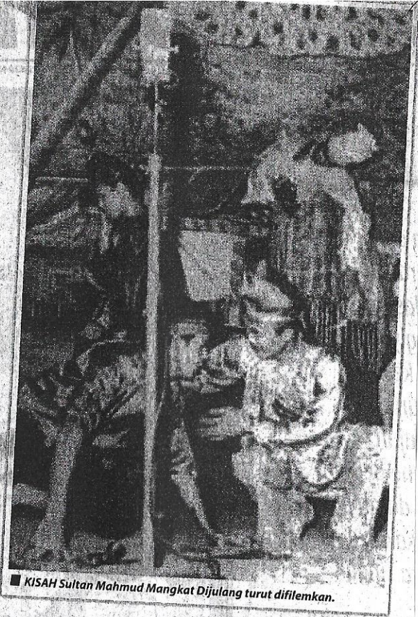
■ KISAH Sultan Mahmud Mangkat Dijulang turut difilemkan.