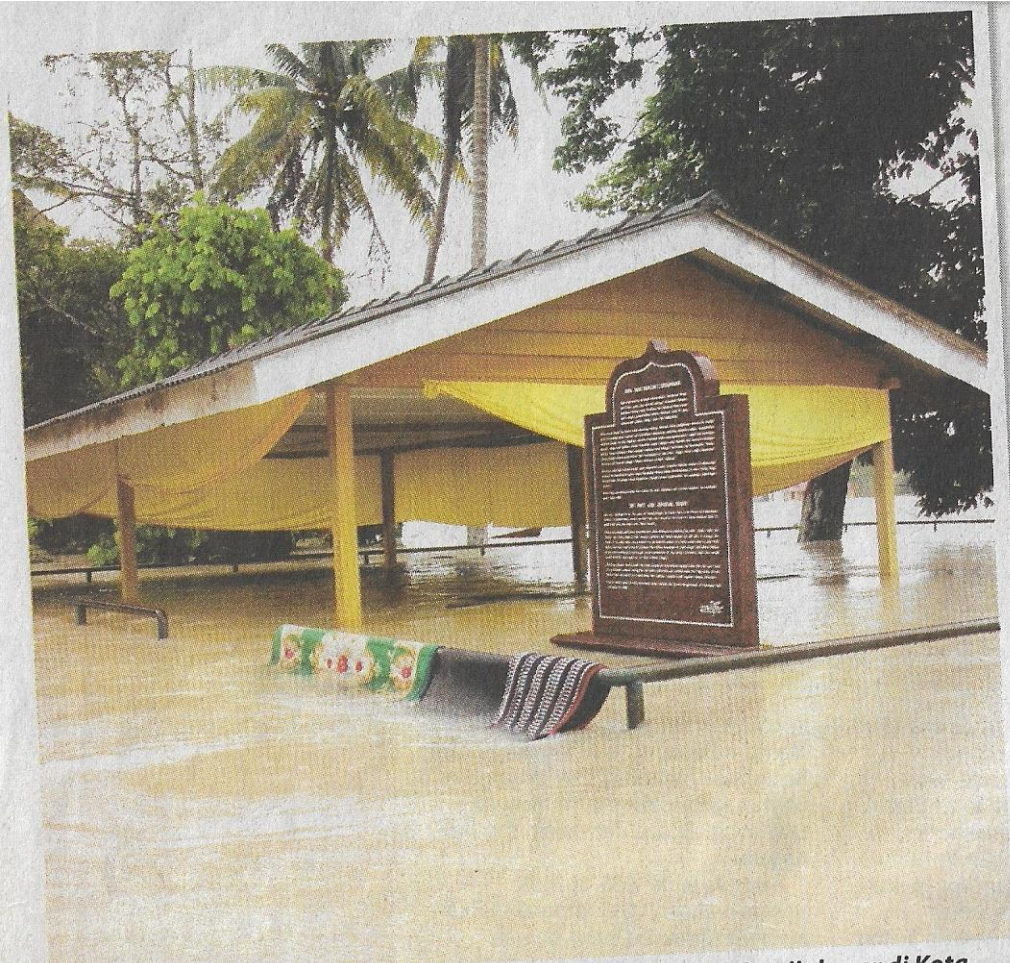
■ MAKAM Laksamana Bentan yang ditenggelami air ketika banjir besar di Kota Tinggi Januari lalu.