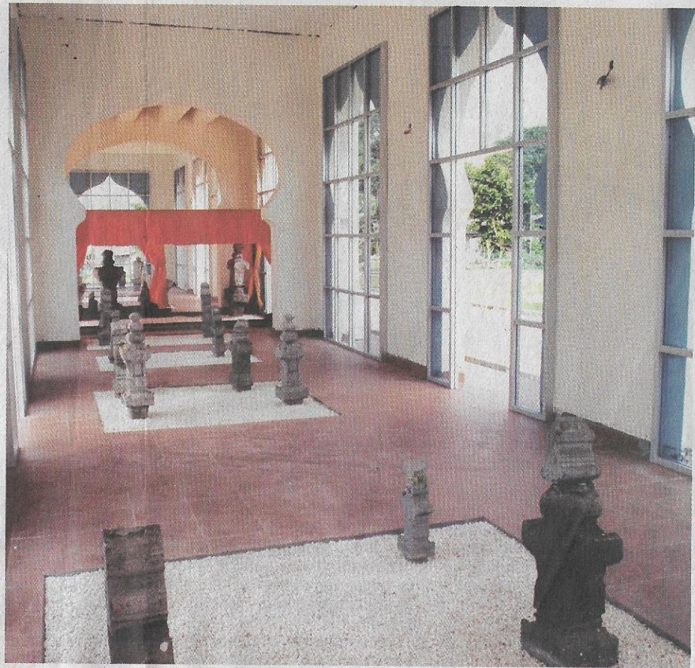
■ Deretan makam termasuk Makam Sultan Mahmud (Mangkat Dijulang), di Kampung Makam tidak dinaiki air.