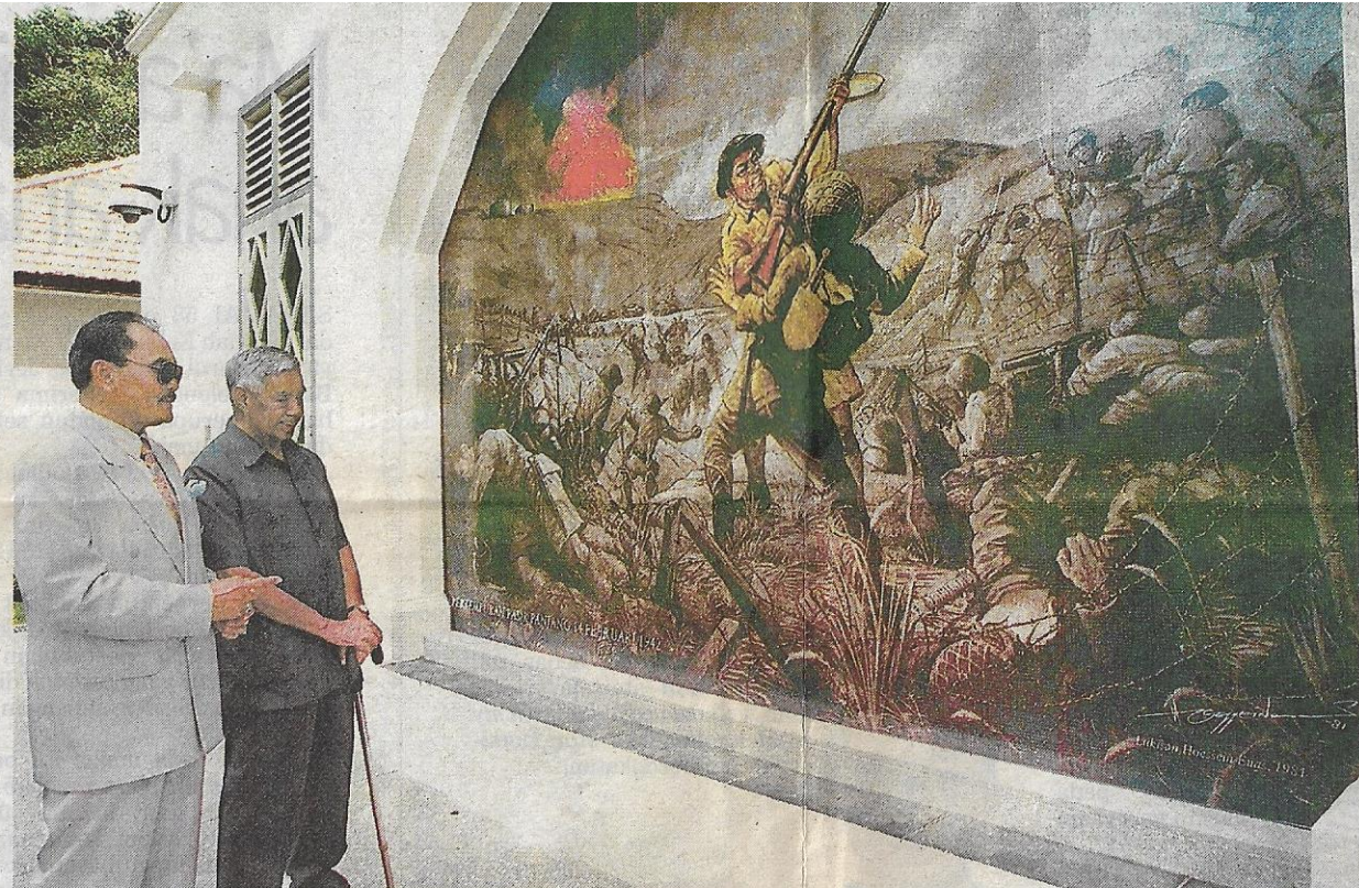
PANGLIMA Tentera Darat, Jeneral Md. Hashim Hussein bersama Tun Ibrahim Ismail melihat lukisan mural perjuangan Lt. Muda Adnan di galeri berkenaan.

Beberapa tubuh anggota Askar Melayu yang telah meninggal dunia atau cedera terus menjadi mangsa tikaman benet tentera Jepun. Dengan rakus, Leftenan Muda Adnan yang tidak berdaya ditangkap dan dimasukkan ke dalam guni sebelum digantung pada dahan sebatang pokok ceri dalam kedudukan